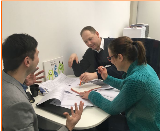
... zur Umsetzung des Managementsystems