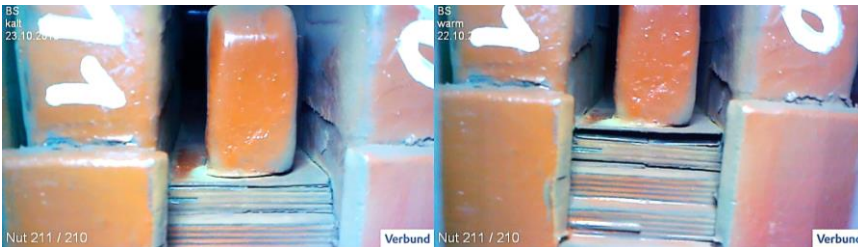
Exakte Nutzuordnung und Gegenüberstellung Kalt-/Warm-Inspektion