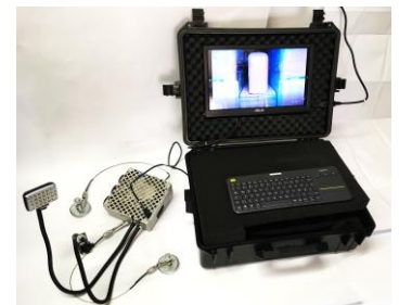
Buckling Visualisation System

VERBUND Hydro Power GmbH, Europaplatz 2, 1150 Wien, Österreich Wilfried Reich, T.: +43 (0)50 313-54 420, E.: wilfried.reich@verbund.com www.verbund.com/hydro-consulting