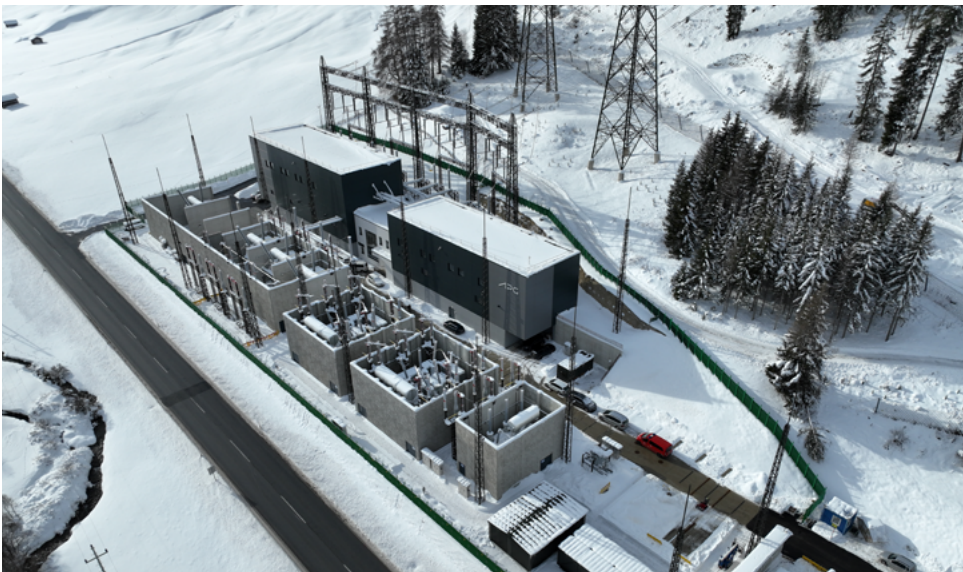
Anlage im Schnee: Vom neuen Tiroler Umspannwerk von APG in Nauders verläuft nun eine Verbindungsleitung nach Italien.

Die Verbindungsleitung von APG zwischen dem österreichischen und dem italienischen Stromnetz verlief früher von Lienz bis Soverzene. Um die Kapazitäten für den Stromtransport auszubauen, entstand eine zusätzliche neue Verbindung von Tirol in die Lombardei.