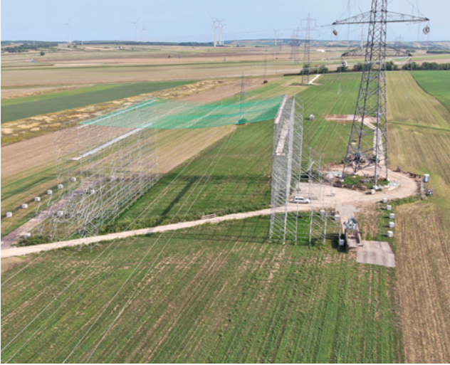
Die neue Weinviertelleitung umfasst 202 Masten – jeder davon ist rund 60 Meter hoch.