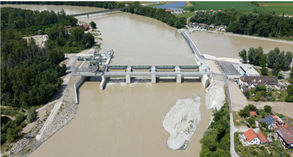
Wehr Jettenbach: Die neu gebaute Wehranlage am Inn regelt den Zufluss zum Laufkraftwerk.

Mit der Erneuerung des Kraftwerks Jettenbach-Töging wurde eines der ältesten Laufkraftwerke am Inn fit für die Zukunft gemacht und die Erzeugung um knapp ein Viertel gesteigert.