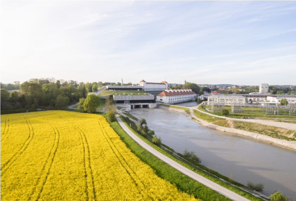
Kraftwerk Töging: Die Neuanlage ist seit 2022 in Betrieb (Bildmitte). Rechts davon schließt die Altanlage an (Stand Sommer 2023).