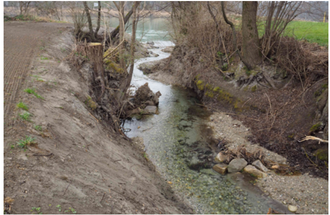
Neugestaltung für Tiere und Pflanzen: eine Bachmündung in den Rückstauraum Jettenbach