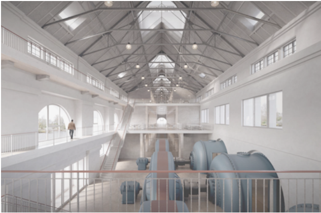
Nachnutzung des alten Krafthauses Töging: ein Blick in den multifunktionalen Marktplatz mit den drei alten Maschinenplätzen