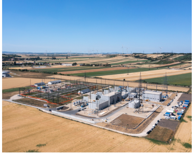
Im Zuge des Projekts wurde auch das Umspannwerk in Neusiedl an der Zaya neu errichtet.