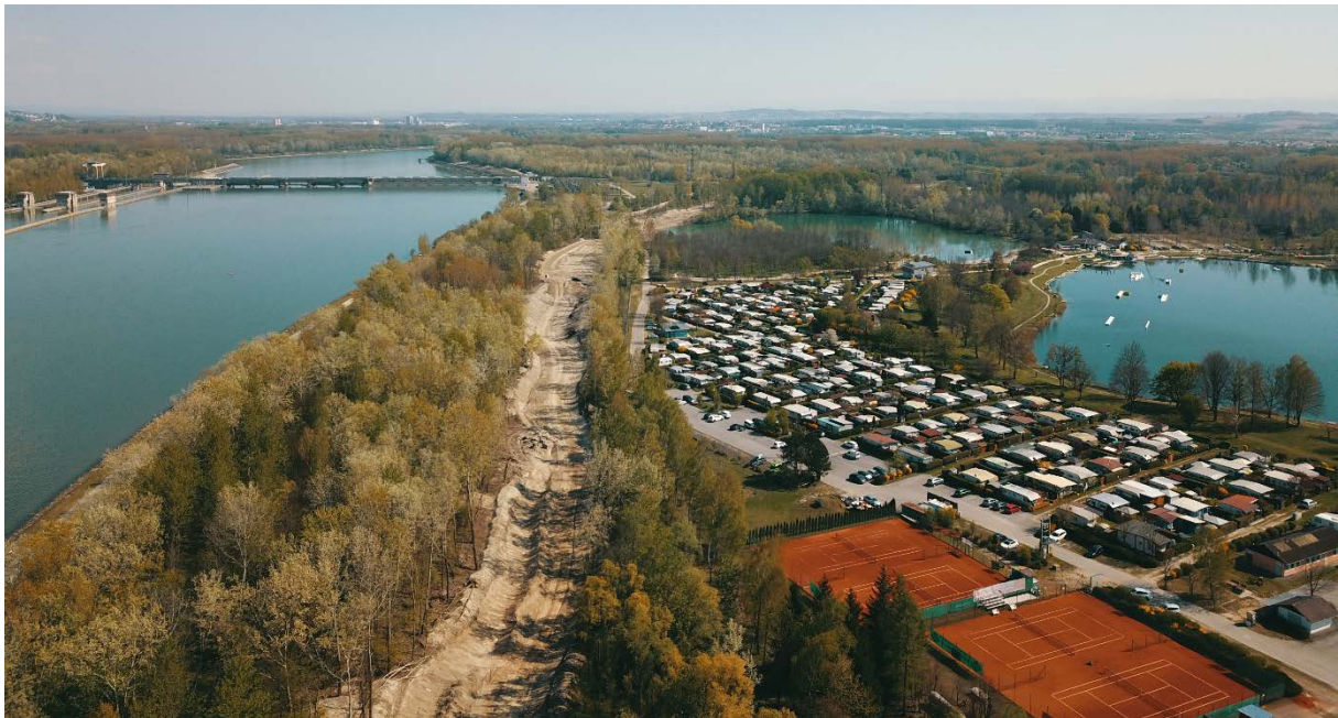
Baustelle FWH Abwinden, April 2019 – gerodete Trasse und Aushubarbeiten Gerinne sichtbar