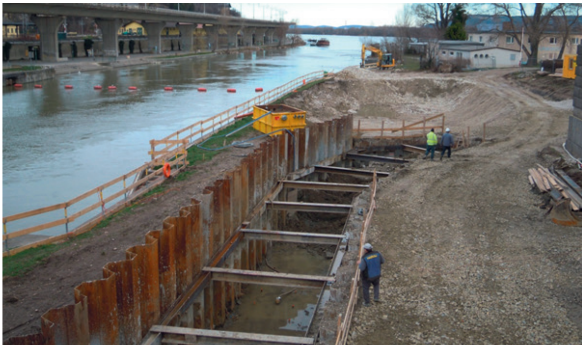
Bauphase des oberwasserseitigen Schlitzpasses