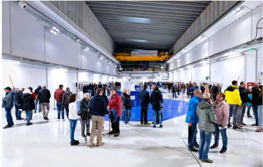
Regler Andrang: Beim Tag der offenen Tür im neuen Kraftwerk Töging am 1. Oktober 2022 machten sich viele Menschen selbst ein Bild vom Projekt.

Die Einbindung der Kommunen und Anwohner:innen bereits zu Projektbeginn ist ein wesentlicher Baustein für die erfolgreiche Umsetzung. Schon kurz nach der Berufung des Projektteams wurde das Projekt in einer Informationsveranstaltung der Bevölkerung vorgestellt. So standen dieser von Anfang an kompetente Ansprechpartner:innen aus den Bereichen Projektmanagement, Betrieb, Recht und Ökologie zur Verfügung.