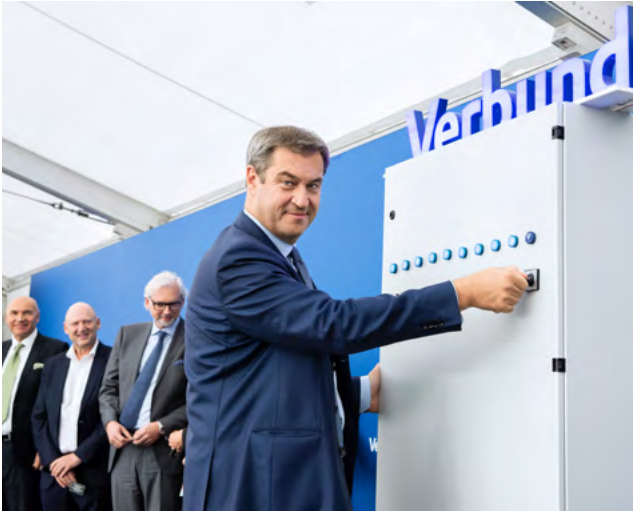
Feierliche Inbetriebnahme: Gemeinsam mit dem VERBUND-Vorstand (links) eröffnete der bayerische Ministerpräsident Markus Söder das erweiterte Kraftwerk Jettenbach-Töging.