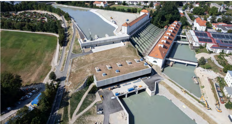
Kraftwerk Töging: Der Neubau des Krafthauses (Bildmitte) mit der rechts anschließenden Bestandsanlage im Hintergrund (Stand 8. August 2022)

Mit der Erneuerung des Kraftwerks Jettenbach-Töging wurde eines der ältesten Laufkraftwerke am Inn fit für die Zukunft gemacht. Dadurch wird die Erzeugung um knapp ein Viertel steigen.