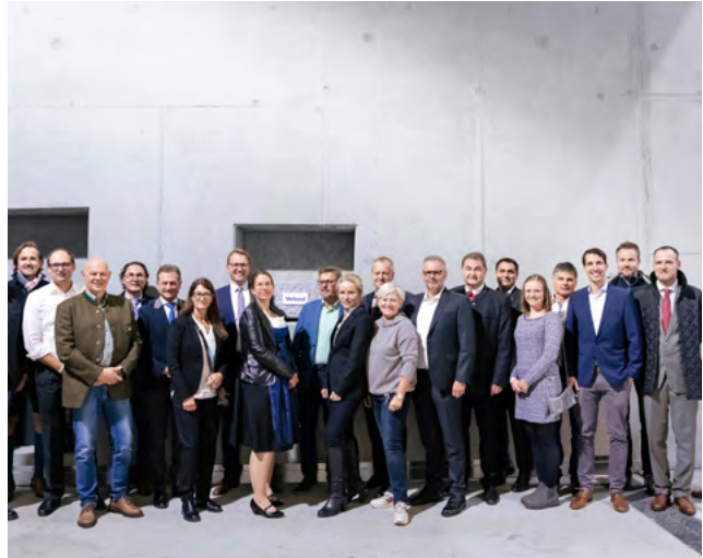
Stolzes Team: Die Geschäftsleitung der VERBUND Innkraftwerke GmbH und die Menschen hinter dem Projekt freuen sich über die erfolgreiche Umsetzung.

Der Abschluss des Hauptprojekts erfolgte nach Zeitplan Ende 2022. Abschließende Restarbeiten finden 2023 statt – vor allem für ökologische Ausgleichsmaßnahmen.