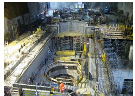
Kavernenbaustelle beim Pumpspeicherkraftwerk Reißeck in Kärnten