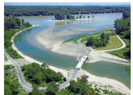
Renaturierungsprojekt am Fluss Traisen in Niederösterreich