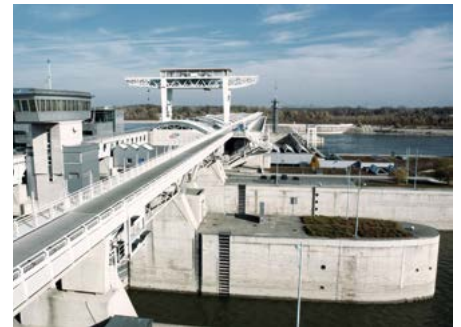
Donaukraftwerk Freudenua bei Wien