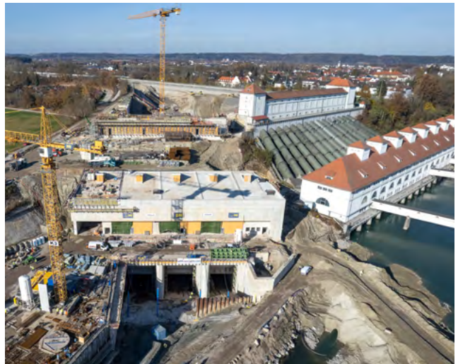
Der Neubau des Krafthauses Töging (Bildmitte) mit der Bestandsanlage am rechten Bildrand. Für Abschlussarbeiten ist der Ausleitungskanal im Hintergrund bereits entleert (Bauzustand: September 2021).

Mit der Erneuerung des Kraftwerks Jettenbach-Töging wird eines der ältesten Laufkraftwerke am Inn fit für die Zukunft gemacht. Dadurch wird die Erzeugung künftig um knapp ein Viertel steigen.