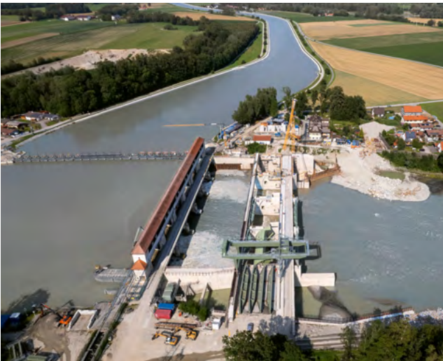
Die bestehende Wehranlage Jettenbach (links) und der Neubau (Bildmitte) mit Blick auf den Ausleitungskanal (Bauzustand: Juli 2021)