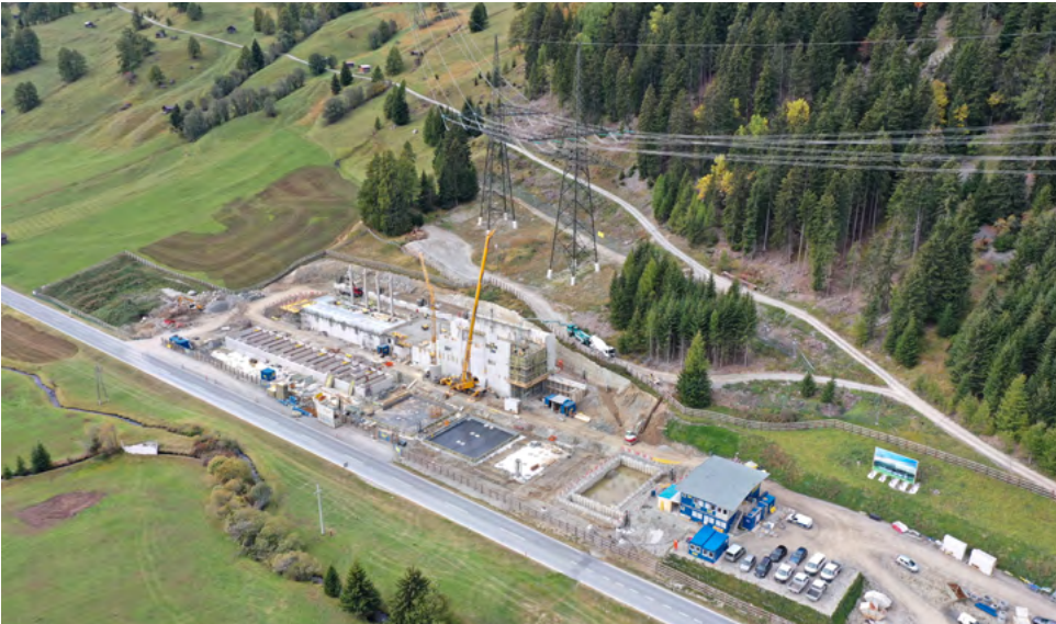
Vom neuen Umspannwerk der APG in Nauders in Tirol verläuft künftig eine Verbindungsleitung nach Italien.

Die Verbindungsleitung der APG zwischen dem österreichischen und dem italienischen Stromnetz verläuft aktuell von Lienz bis Soverzene. Um die Kapazitäten für den Stromtransport auszubauen, entsteht nun eine zusätzliche neue Verbindung von Tirol in die Lombardei.